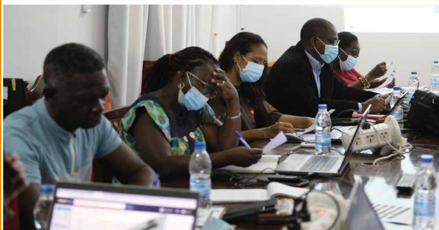
Les participants à la formation en Leadership