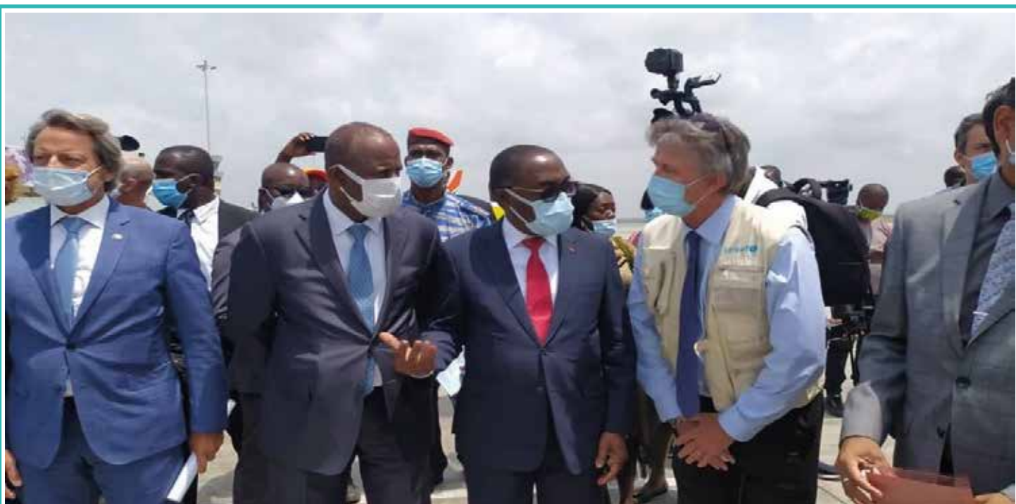
Le Ministre de la santé à la réception des vaccins Covid-19