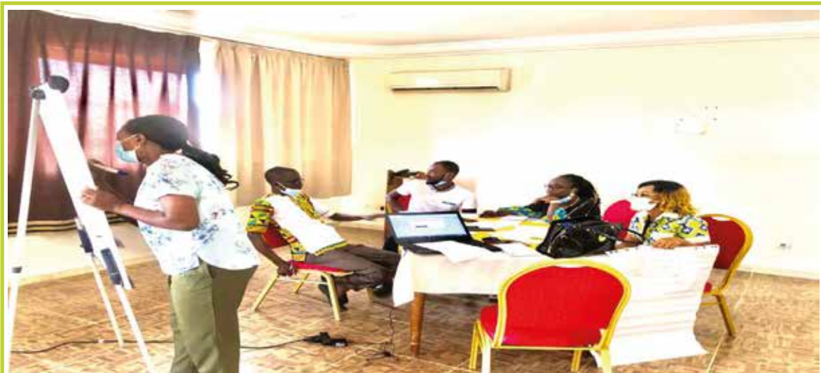
Les participants à la formation en ligne ECAPS.CI