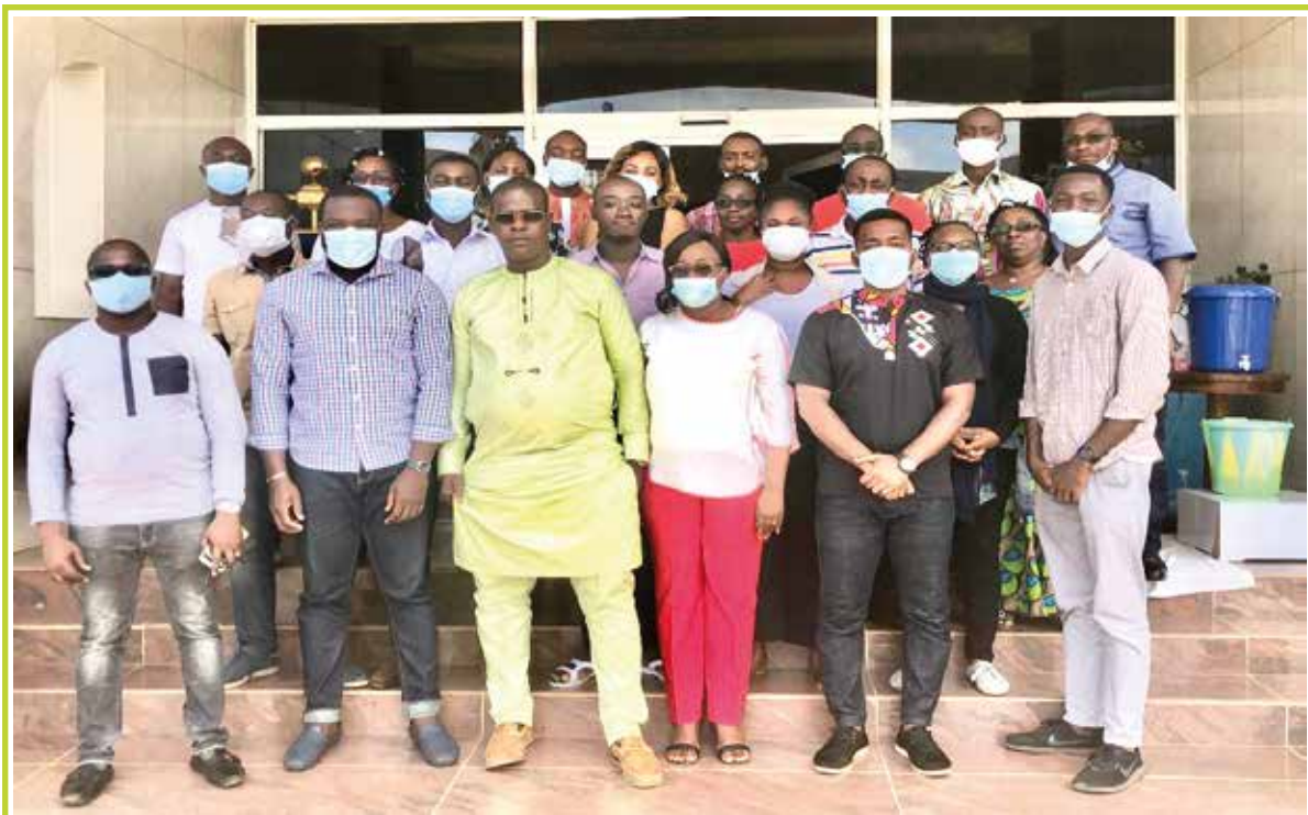
Les points focaux départementaux de la plateforme ECAPS.CI