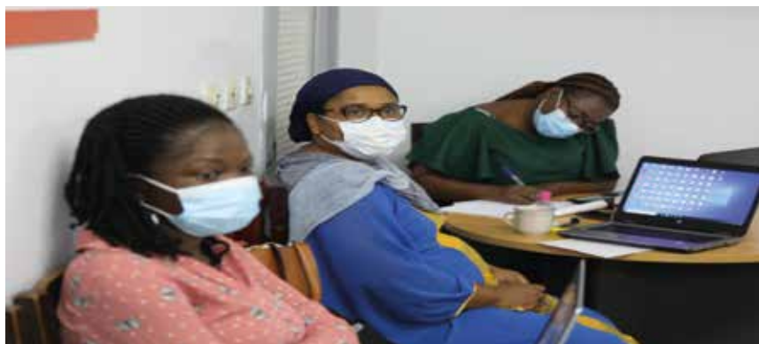
Les participants à la formation en Analyse des données

Le thème de la première formation était « Leadership Management », elle a eu lieu les vendredis 5, 12 et 19 février 2021 au sein de ladite direction. L'objectif était de renforcer les capacités du personnel technique et administratif de la DAP sur les pratiques de leadership et management.