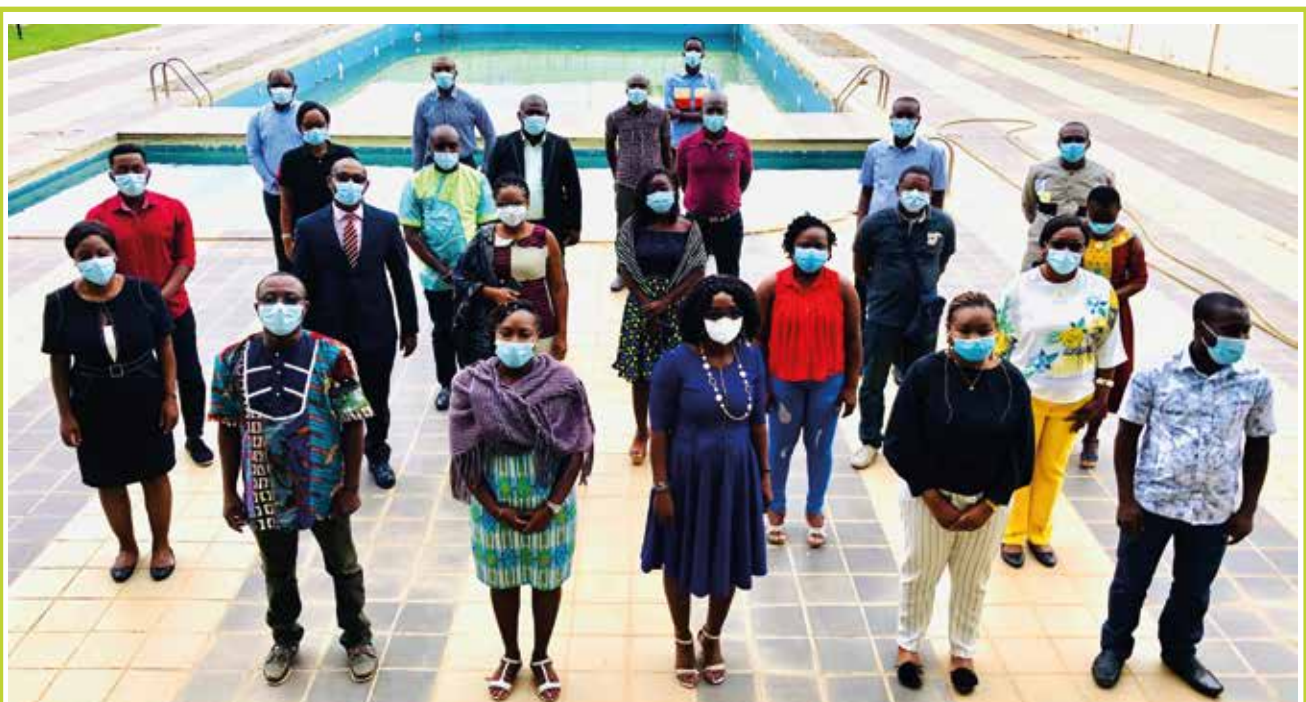
Les coordonnateurs régionaux de la plateforme ECAPS.CI