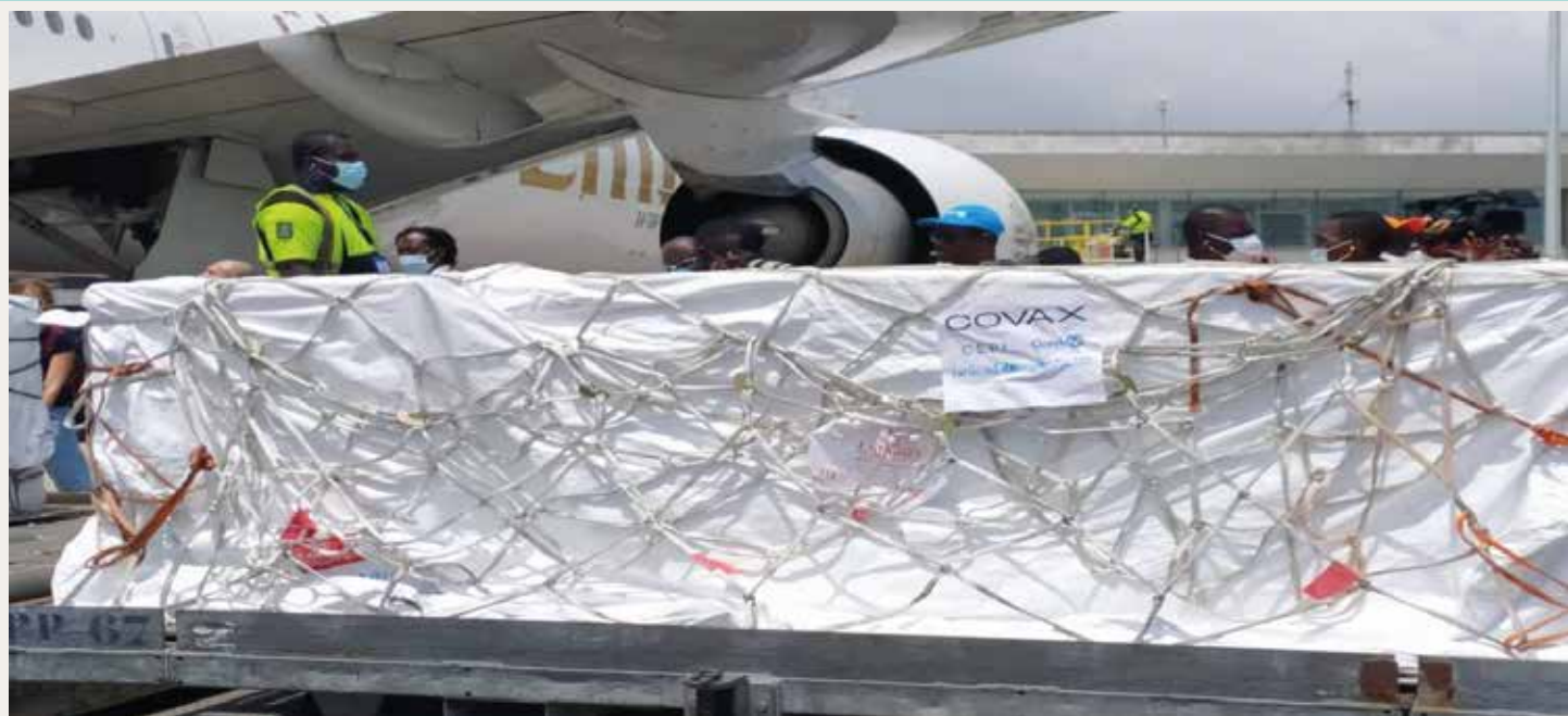
Le débarquement du vaccin AstraZeneca à l'aéroport FHB

Au terme de l'atelier d'actualisation du plan opérationnel de déploiement de la vaccination contre la Covid-19, le vendredi 19 février 2021 à Grand-Bassam, le directeur général de la santé, Pr Mamadou Samba, a annoncé l'arrivée du vaccin contre la Covid-19 en Côte d'Ivoire pour fin février 2021. Finalement, 504 000 doses de vaccin AstraZeneca homologué par l'OMS sont disponibles depuis le 26 février 2021 pour 252 000 personnes cibles à raison de deux doses par personne.