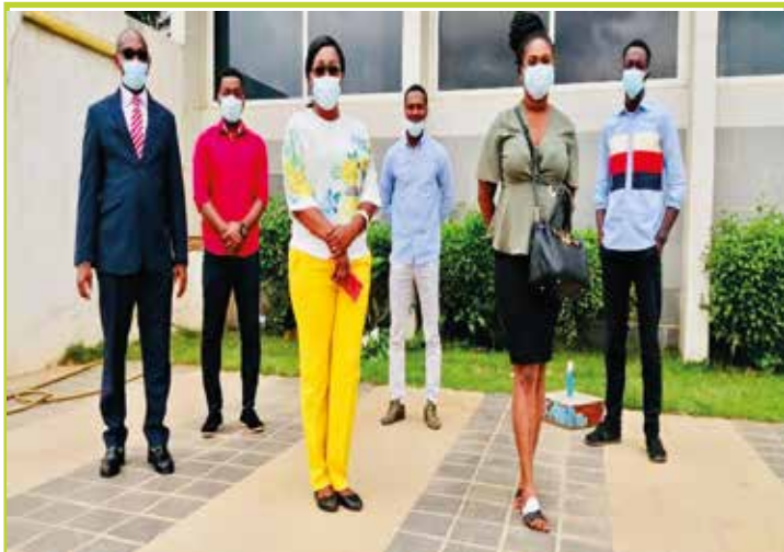
L'équipe projet E-learning de la DAP