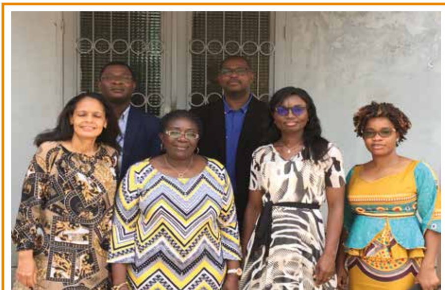
L'équipe de direction de la DAP