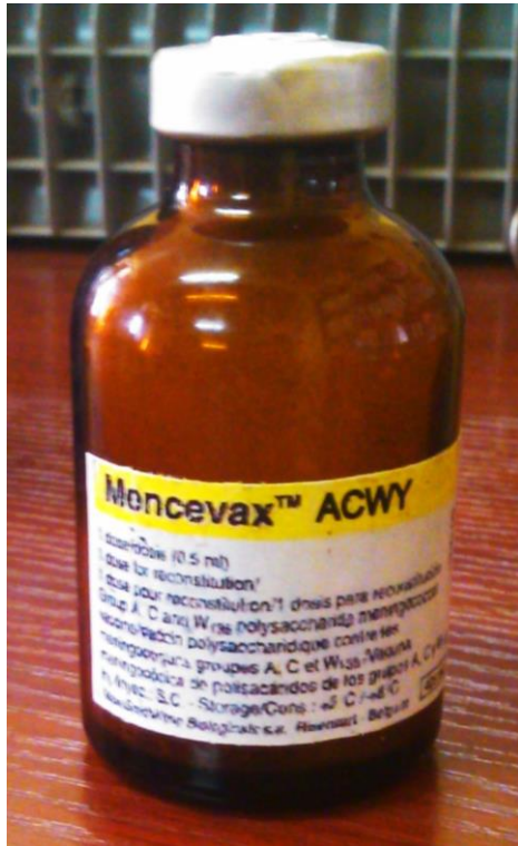
Fig. 1.: Mencevax falsifié, lot AMEHA020AA